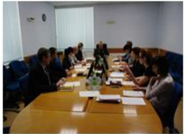
2 июня 2017 года