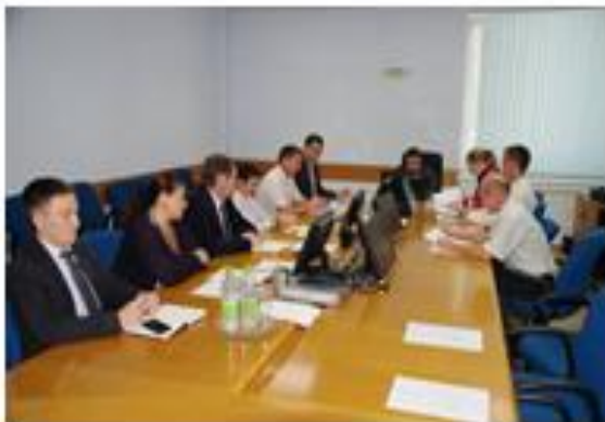
15 сентября 2017 года