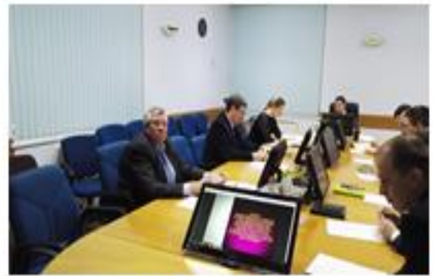
30 ноября 2017 года