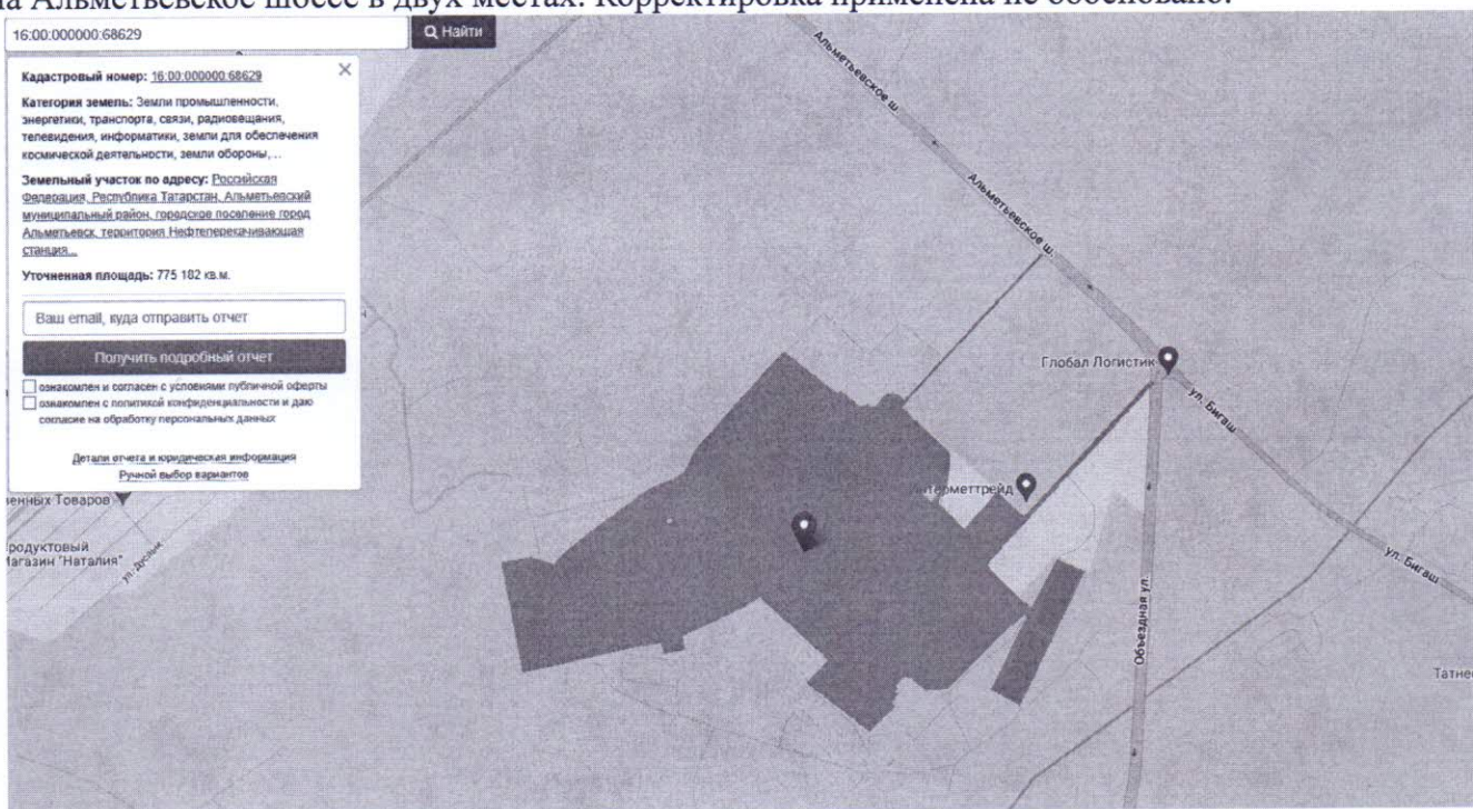
Расположение объекта оценки относительно автотрассы

2.2 Оценщик применил корректировку на удаленность от красных линий (с.44). Объект оценки представлен как удаленный от красной линии. Однако объект оценки имеет прямой выезд на Альметьевское шоссе в двух местах. Корректировка применена не обосновано.