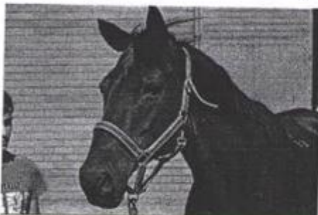
Лошадь БОВИЗЯ, 1999 г.р., инв. № 0001700028 Тракененская кобыла гнедой масти