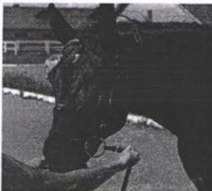
Лошадь ЗИДАН (ЗАДВИНСК), 1999 г.р., инв. № 0001700005 Караковый мерин русской рысистой породы