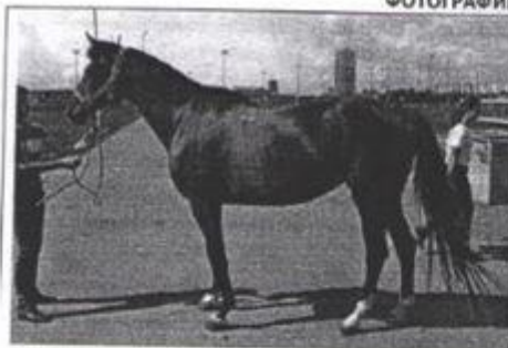
ФОТОГРАФИИ ОБЪЕКТОВ ОЦЕНКИ