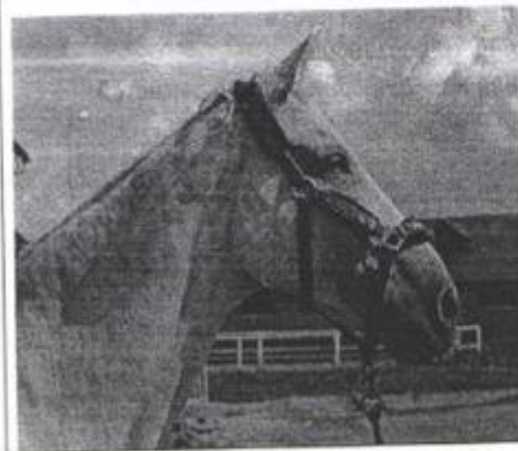
Лошадь ИРБИС, 1995 г.р., инв. № 0001700003 Англо-латвийский мерин