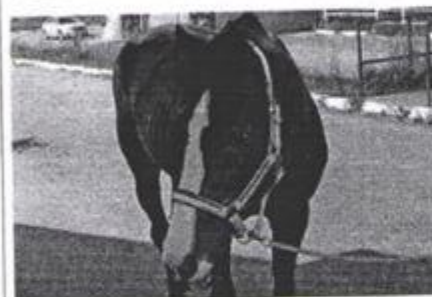
Лошадь ЗАКАЗ, 1999 г.р., инв. № 0001700018 Вороной жеребец русской рысистой породы

Государственное бюджетное учреждение дополнительного образования Республиканская детско- юношеская спортивная школа по конному спорту 420045, г. Казань, ул. Патриста Лумумбы, дом 47А, МКСК тел.: (843) 279-29-42 e-mail: komsibolekazan@yandex.ru ИНН 1609024660 КПП 166001001